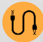
Fios e Cabos