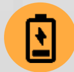
Pilhas e Baterias