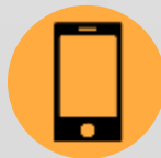
Informática e Telecomunicações