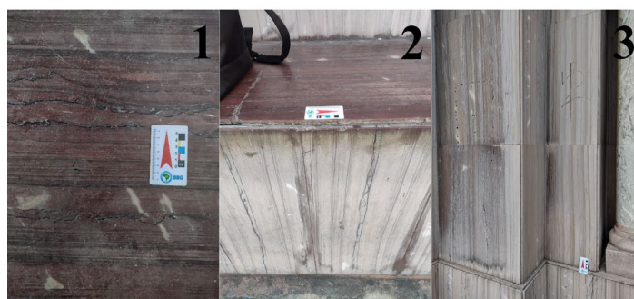
Figura 2: Mármore Vermelho Esperança com alteração de coloração no Santuário Basílica São Sebastião dos Frades Capuchinhos - a) Banco com coloração avermelhada; b) Comparação de tons do banco e da fachada; c) Fachada com revestimento esbranquiçado.

O Mármore Vermelho Esperança da fachada do ponto 3 apresentou uma alteração em sua coloração quando comparado ao mesmo revestimento pétreo presente em um banco na frente do templo (Figura 2). Por esta razão foi realizado teste de cor e brilho. O resultado obtido (Tabela 3) mostrou que os bancos possuem coloração mais escura e tendem às cores vermelha e amarela. Enquanto a fachada apresentou tons amarelados levemente mais fracos e amarelados um pouco mais fortes que o banco, diferenciando-se, de fato, pela coloração mais clara.